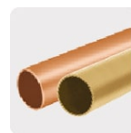
Metales no ferrosos (cobre y latón)