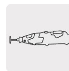
Para herramienta rotativa