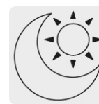
Uso de día y noche