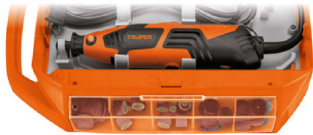
Compartimento posterior para herramienta y compartimentos laterales para accesorios