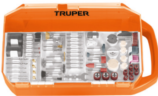
Estuche organizador que facilita el almacenamiento de los accesorios