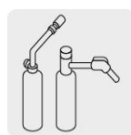
BOQ-PR, MECH-PR y SOP-201