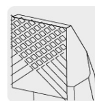
Mordazas con moleteado cruzado