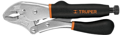
Apertura máxima 2" (50 mm)