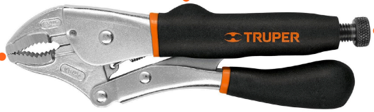
Mordazas de acero al cromo molibdeno