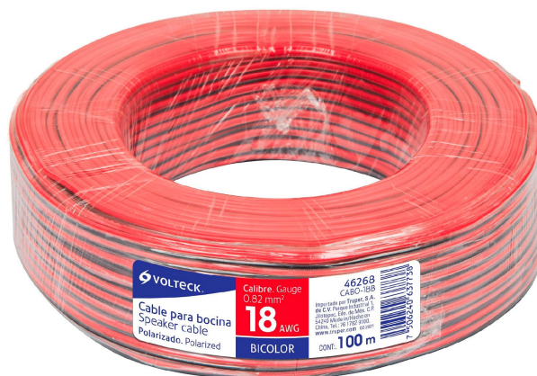
Rollo de 100 m