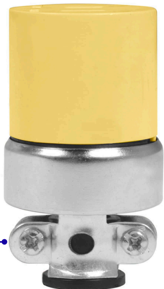
Abrazadera de acero