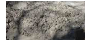
Cemento CPC 30R Extra