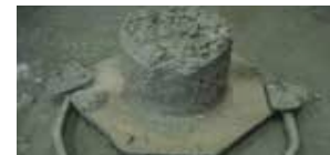
Cemento CPC 30R Extra