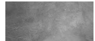
Cemento CPC 30R Extra

Mezclas de concreto con revenimiento de 10 cm