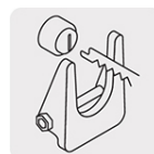
Sistema de cambio rápido