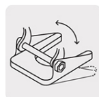
Zapata ajustable tipo pivote