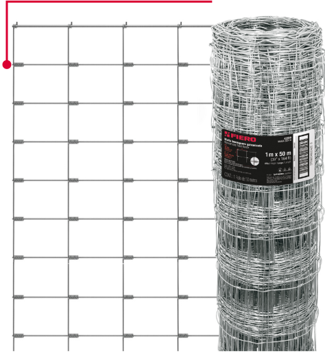
Empalmes en las bisagras