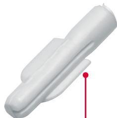
Cinturones de resistencia y anclas retráctiles de fijación