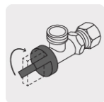
1/4 Vuelta Suave apertura