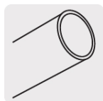
Tubos tipo "M", para presión regular