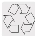
El cobre es un material reciclable